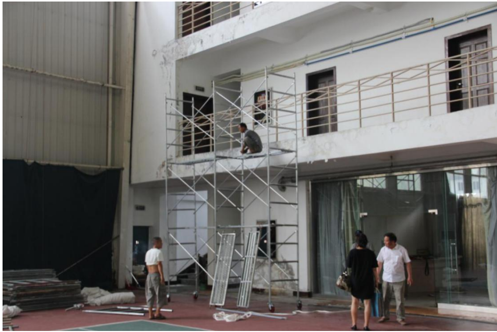
旧网球馆附房维修前照片