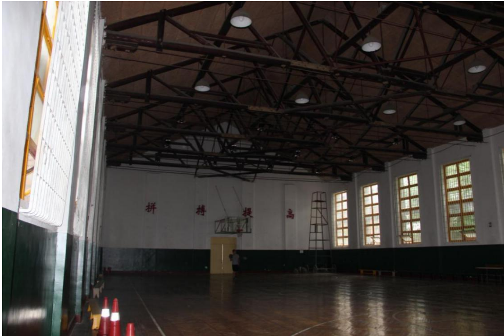
旧篮球馆维修前照片