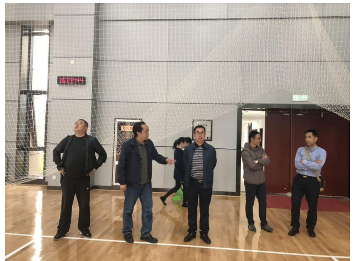
实地考察体育馆主场馆