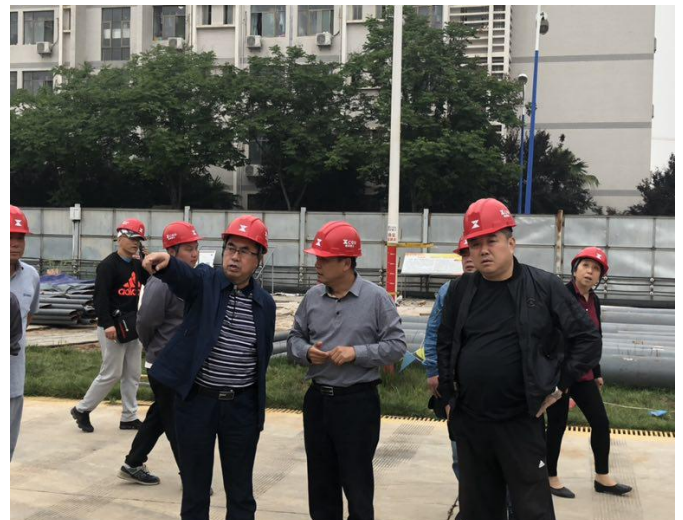
考察西安外国语学院场馆建设现场