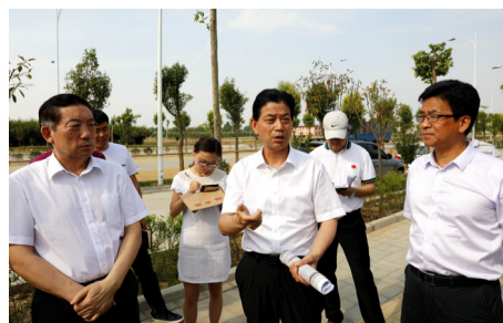
陕西省政府副秘书长王晓驰（中），省体育局局长姚金荣（左）一行视察我院新校区项目建设情况

据悉，中国体育舞蹈公开赛是中国体育舞蹈的最高水平赛事，今年设武汉、温州、上海、北京、重庆和深圳6站赛事。上海站的比赛由中国体育舞蹈联合会和上海市体育总会主办、上海市卢湾体育中心承办。共有来自全国81支代表队近2000名运动员参加了此次比赛。