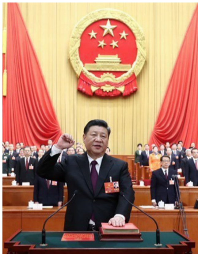
3月17日，十三届全国人大一次会议在北京人民大会堂举行第五次全体会议。习近平当选中华人民共和国主席、中华人民共和国中央军事委员会主席。这是习近平进行宪法宣誓。

(二十) 将中央防范和处理邪教问题领导小组及其办公室职责划归中央政法委员会、公安部。