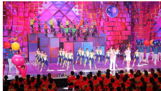
我院学生（中）参与节目录制

本报讯（通讯员 熊辉 牛晓涛）“五月的鲜花”全国大中学生文艺会演（下称文艺汇演）是由中宣部、教育部、团中央主办、中央电视台承办的一档在每年“五四”期间由中央广播电视总台播出的全国品牌示范性展演，今年的文艺汇演以“我们都是追梦人”为主题。