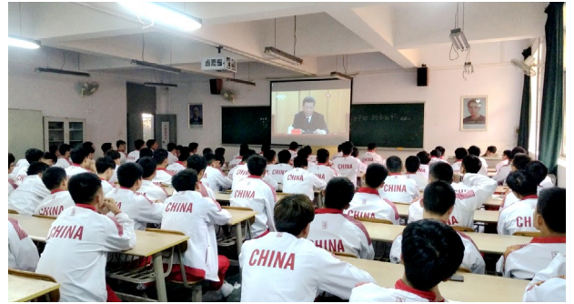
我院师生观看大会直播

学生工作部（处）部长王志刚：习近平总书记的讲话，总结了党和人民探索实现民族复兴道路的宝贵经验，“民族的未来在